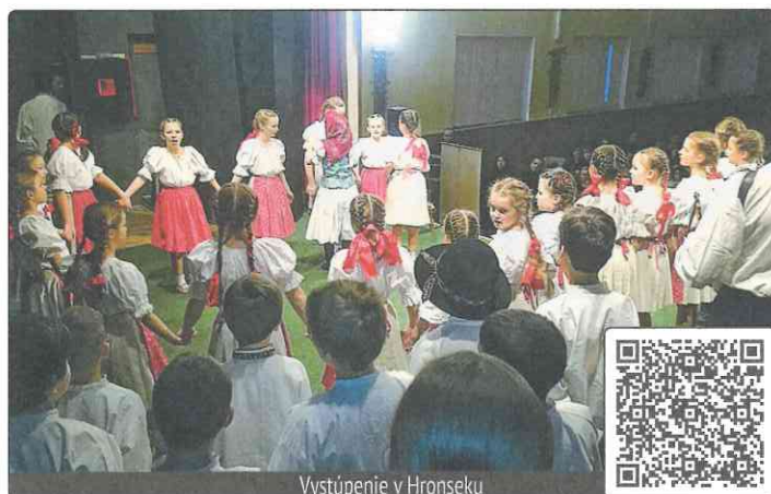
Vystúpenie v Hronseku

Okrem uvedeného sa pravidelne stretávame na nácvikoch každého utorok a štvrtok, kde s deťmi pripravujeme nové choreografie. Plánujeme a pripravujeme rôzne novinky a prekvapenia, a najmä sa tešíme na spoločné stretnutia. Rozprávame sa, počúvame sa, diskutujeme, spoznávame sa... Je ra-