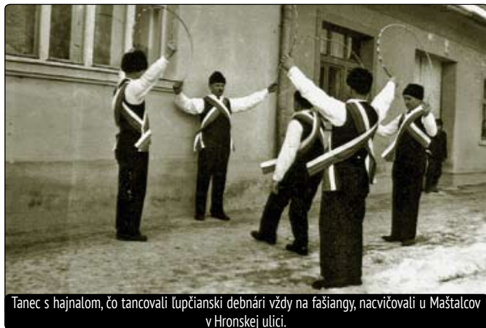
Tanec s hajnalom, čo tancovali Ľupčianski debnári vždy na fašiangy, nacvičovali u Maštalcov v Hronskej ulici.

„Keď mňa život z milovaného rodného hniezda odviaľ do cudzoty, ako rozpomienku naň hľadela som si aspoň suvenírom nejaký zadovať. Od inteligentnej spolucestujúcej zo Španej Doliny vydrankala som zopár metrov čipôčky, lebo i moja drahá mať zamladi „kneplovala“. A v Slovácku kúpila som si geletku ako pamiatku na starého